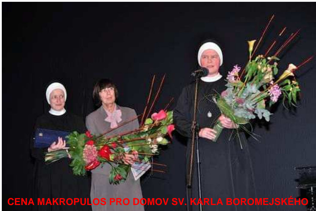
CENA MAKROPULOS PRO DOMOV SV. KARLA BOROMEJSKÉHO

číslo účtu: 174-1950304504 / 0600 / tel. 235 301 209, 235 323 248 fax. 235 302 720 sekretariat@domovrepy.cz