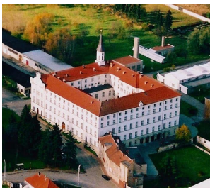
Domov sv. Karla Boromejského a kostel sv. Rodiny

Domov sv. Karla Boromejského ( www.domovrepy.cz ), který se věnuje péči o seniory, přivítal možnost se již podruhé zapojit do aktivit věnovaných Světovému dni hospice a organizací koncertu v prostorách Domova pomoci získat prostředky pro Nadační fond Umění doprovázet .