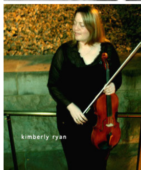
Americké spirituály Leonard Bernstein