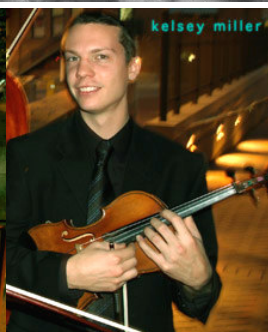
University of Portland